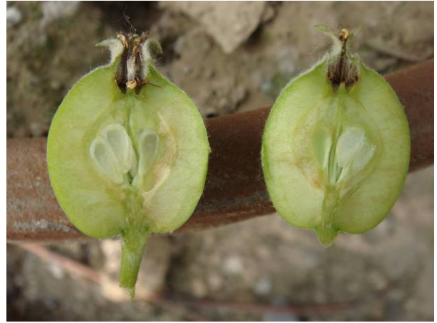
膨大期的幼果萼凹处下陷