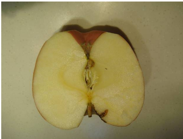
霉心病在成熟果实的初期症状