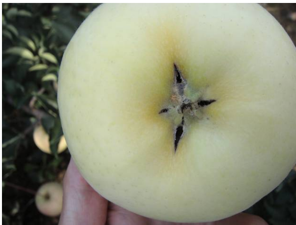
个别果实萼凹处有开裂现象