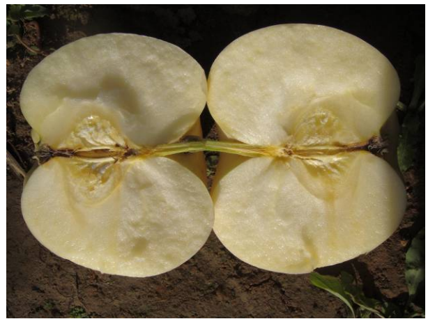
左面果实切开后可见病菌正向果心发展