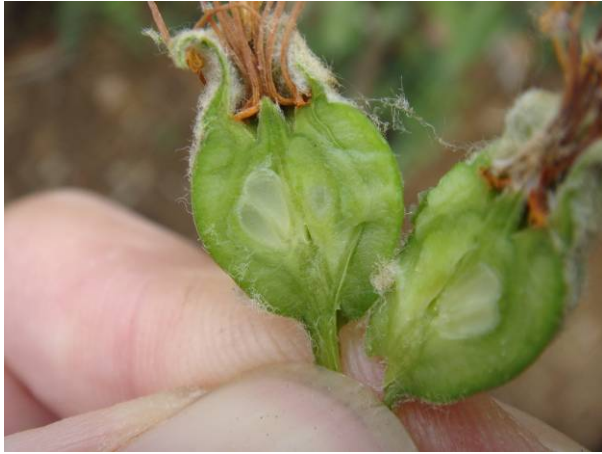
落花时败谢的花药极易被病原菌侵染