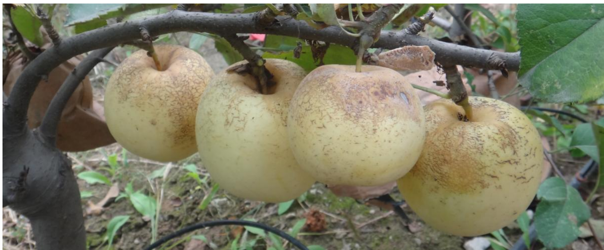
图 20-3 刚去掉果袋的苹果果面出现很多皴裂