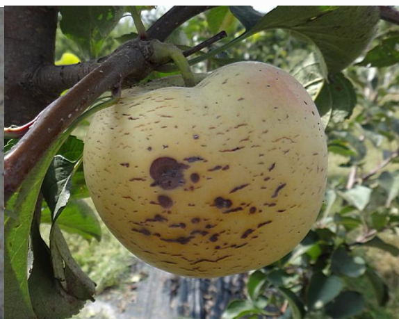
图 20-2 苹果果面的裂纹处被病菌感染