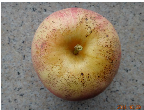
图 20-1 苹果果柄周围呈现出皴裂

需要明确的问题是前期究竟干旱到什么程度以及后期有多大的水量才促成了皴裂的形成。从果园管理角度来看，后期降雨量过大是难以控制的自然因素，怎样在最干旱时给果树补充水分似乎是解决问题的关键，然而，现在缺乏的是对土壤含水量的精确监测和如何进行调控的指导信息。如何避免皴裂伤口被病菌感染也是今后需要研究的一个课题。