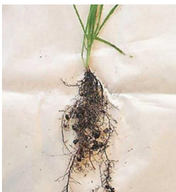
图 24-2 菌丝与杂草根部的土壤聚合物

动物区系，比如蚯蚓会逐渐地将有机残留物和土壤混合在一起。这样将会增加树行间的有机质含量并且保护表层土壤不被雨水冲刷而造成有机质的流失。即被牢固覆盖的土壤不会被侵蚀，水分和养分也不会被冲蚀，土壤也不会形成致密坚硬且不透水的硬壳了。