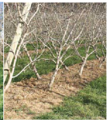
图 24-4 果树根部杂草被除掉