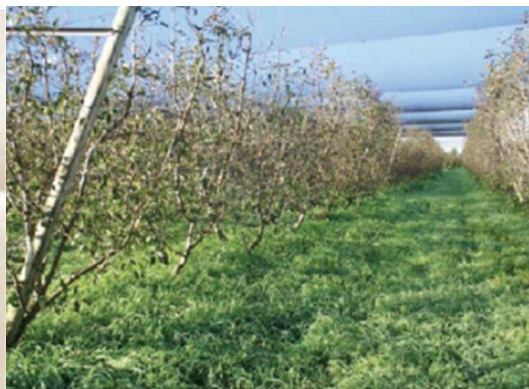
图 24-3 果园遍布杂草