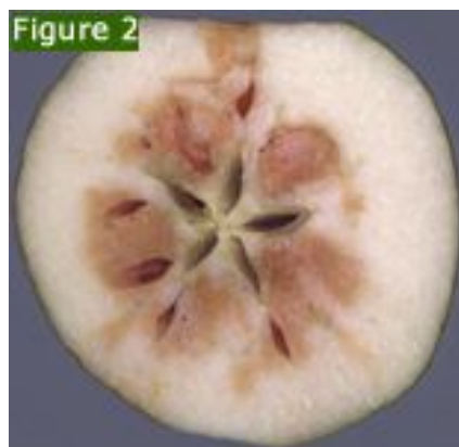
图 7-6 苹果果肉二氧化碳伤害

2%以上, 这样就会造成 CO 2 胁迫。苹果 CO 2 伤害的程度与品种、采收期、贮藏温湿度有关。红富士苹果对 CO 2 十分敏感, 库内堆码密集、通风不良、贮藏包装内衬薄膜过厚均会导致 CO 2 伤害, 且随着果实成熟度的增大, 伤害现象有加重趋势; 低温条件下, 果实对 CO 2 敏感性增加。防止 CO 2 伤害要做到以下几方面: