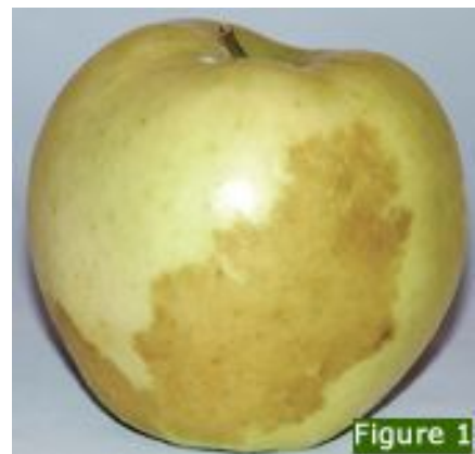
图 7-5 苹果表皮二氧化碳伤害

苹果 CO 2 伤害有果实外部伤害和内部伤害两种。外部伤害发生在贮藏前期，病变组织界限分明，呈黄褐色，下陷起皱（图 7-5）。内部伤害多发生在贮藏中后期，危害较为严重，起初果肉果心局部组织出现褐色小斑块，随后病变部分果肉组织失水呈浅褐色空腔（图 7-6），果肉风味变淡，伴有轻微发酵味或苦味；病变也可能扩展到果皮，果皮上出现褐斑，直至果皮全部褐变，并出现皱褶。二者的相同之处是受害果实硬度偏高，坏死组织仍有弹性。