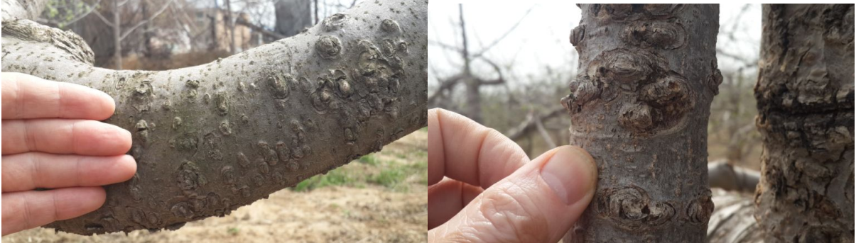
图 7-2 在洛川果园发现的枝干轮纹病病瘤比在渤海湾产区的病瘤要大