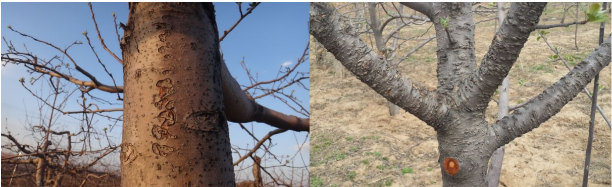
图 7-1 在洛川果园见到的枝干轮纹病

在此，特别提醒黄土高原苹果产区的果农：一是要高度关注枝干轮纹病，该病已经普遍存在，要学会通过症状识别轮纹病；二是要做好病害的防控工作，加大雨季对枝干的化学保护力度，力争将枝干轮纹病控制在较低的水平，使其不对生产造成大的危害。