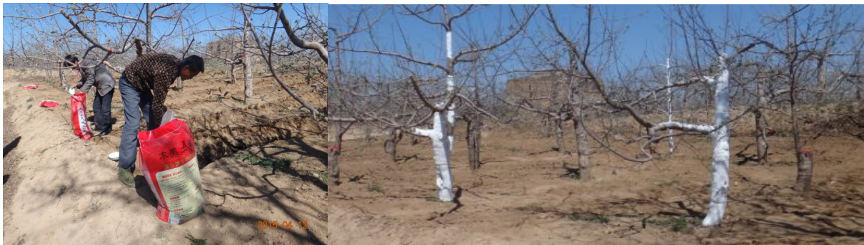
图 7-3 在洛川开展土施木美土里菌肥和树干涂轮纹终结者 1 号的防腐烂病田间试验