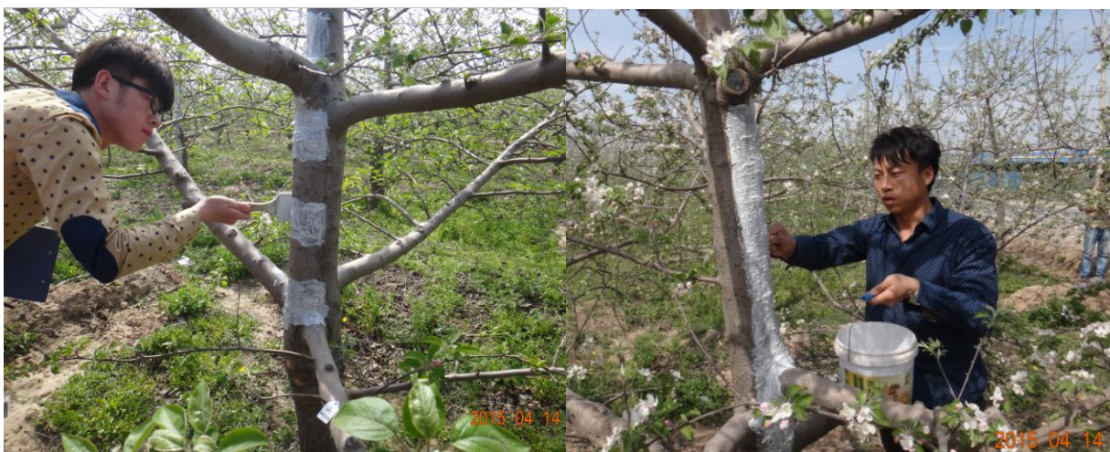
图 7-4 在临猗开展涂刷轮纹终结者 1 号的防控枝干轮纹病的田间试验