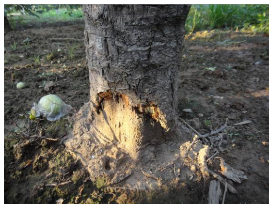
图 14-11 被细钻螺啃食后的树皮