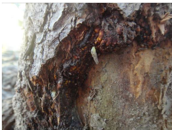
图 14-10 正在啃食树皮的细钻螺