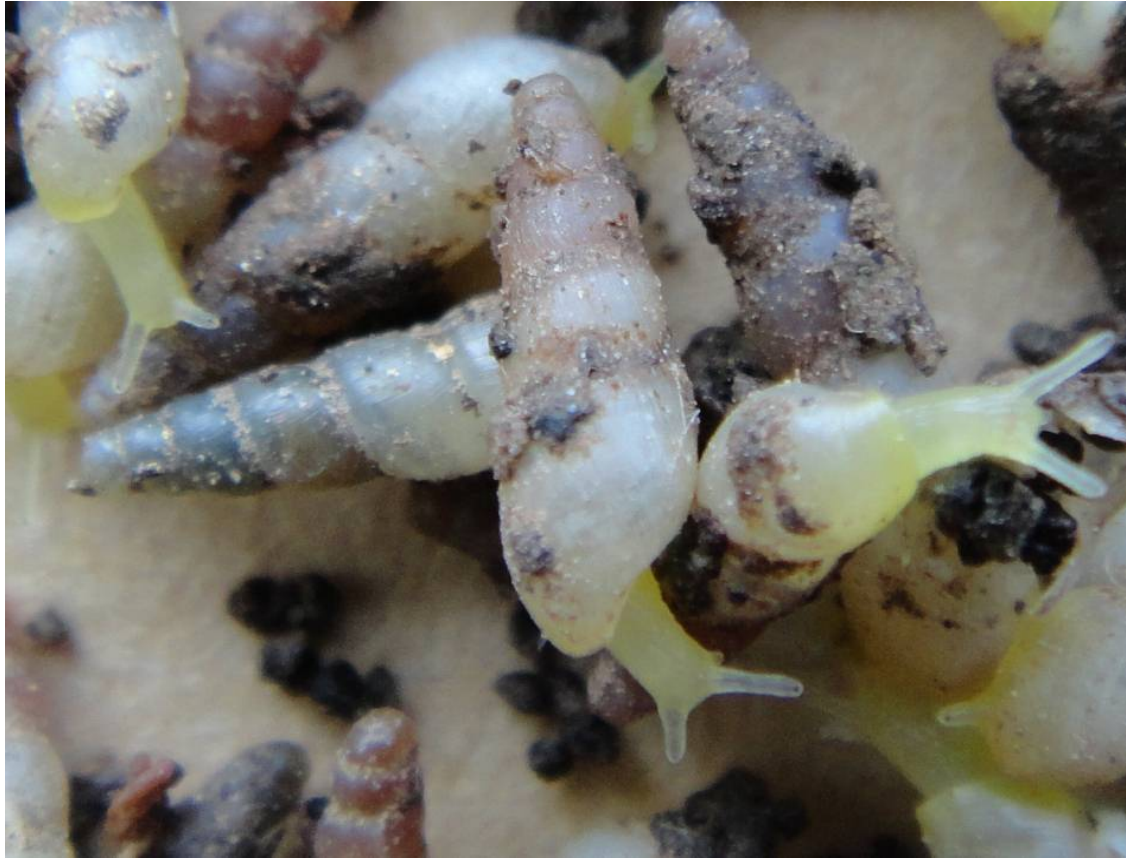
图 14-12 被放大的细钻螺