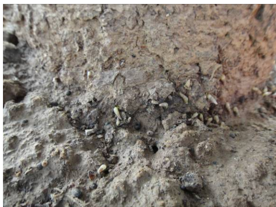
图 14-8 聚集在树干基部的细钻螺

经河北农业大学植物保护学院王勤英教授鉴定后认为，这种害虫是细钻螺 [ Opeas gracile (Hutton)]。根据现有资料，还未发现细钻螺危害苹果树的报道。我们将对其危害和防控情况作进一步的关注。