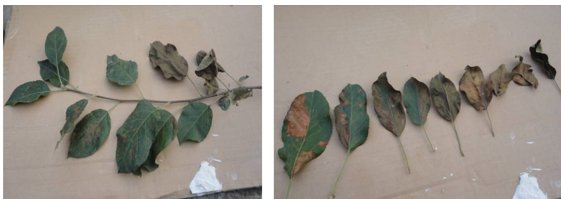
图 14-2 苹果树叶片中部出现枯死斑