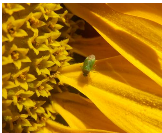
图 14-5 6月14日油葵花盘上的绿盲蝽