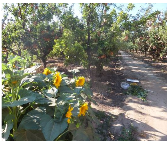
图 14-4 果园地边种植油葵