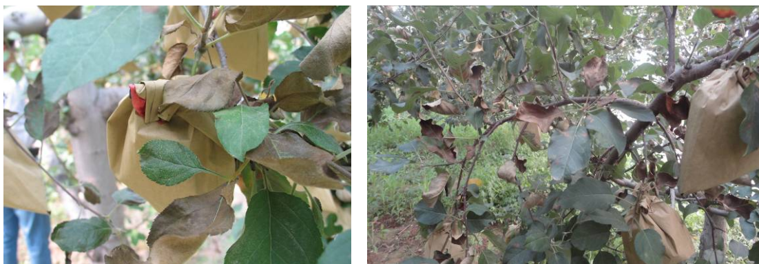
图 14-1 苹果树整个叶片青枯

参加调研的还有吉县果树中心技术站站长朱峰，陕西省宜川县果业局张彦刚，吉县文成乡果树站站长郭文龙。