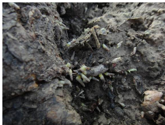
图 14-9 正在啃食树根的细钻螺