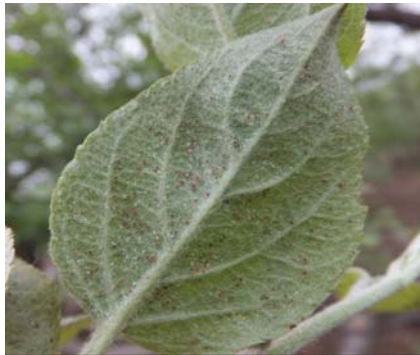
图 10-17 叶片背面的红蜘蛛