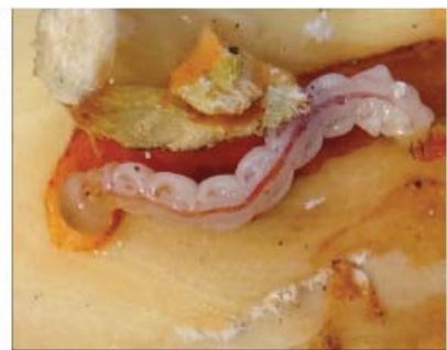
图10-5 苹小吉丁虫幼虫的放大