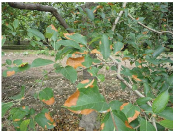
图 10-13 出现在金冠叶片上的坏死斑