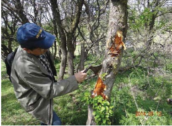
图10-9 发生在主干上的腐烂病