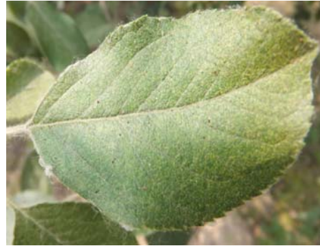
图 10-16 变色的被害叶片及叶面上的红蜘蛛