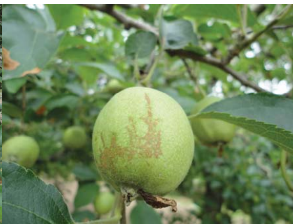
图 10-14 发生在幼果上的果锈