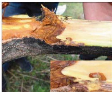
图10-7 由苹小吉丁虫伤口引发的腐烂病