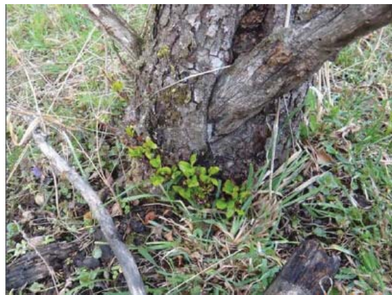
图10-12 枯树下面的野苹果幼苗（未来的希望）