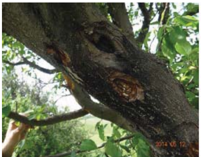
图10-6 苹小吉丁虫造成的枝干损伤