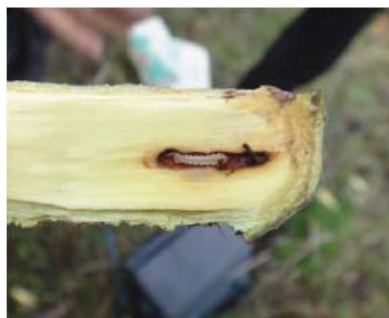
图10-4 在韧皮部为害的苹小吉丁虫幼虫