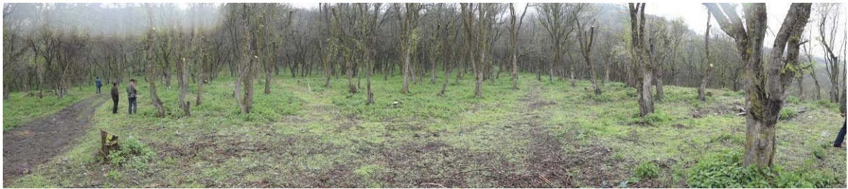
图10-1 新源县野果林改良场因苹小吉丁虫和腐烂病为害严重，很多树枯死