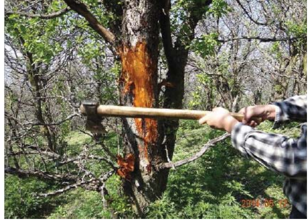
图10-10 腐烂病导致树体死亡