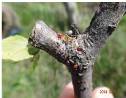
图10-3 苹小吉丁虫排泄的红色粘液图