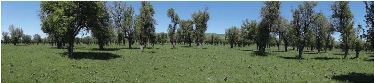
图10-2 新源县八连野果林以前苹小吉丁虫危害严重但未发生腐烂病，经自然恢复焕发出新的活力