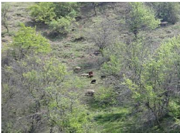
图10-11 在禁牧区依然发现有羊群在啃食