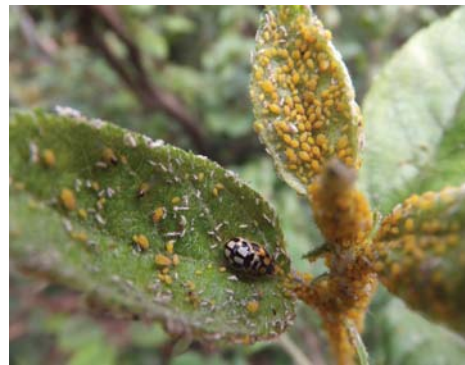
图 10-18 苹果嫩梢上的苹果黄蚜和取食蚜虫的瓢虫