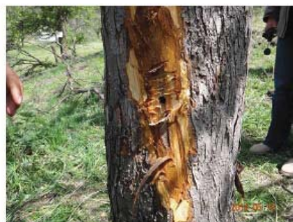
图10-8 在主干上由打药孔引发的腐烂病