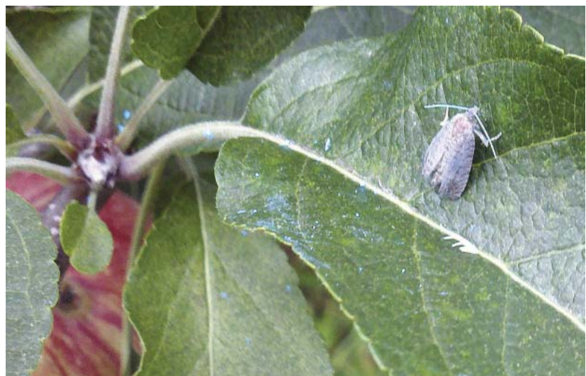
图 10-19 McGhee 释放的被标记的不育的雄性苹果蠹蛾

市场上的气雾发散器的标准程序是要求从黄昏开始释放 12 小时的信息素，那样好吗？McGhee 削减了—半的释放时间，然后再减半。他发现释放 6 个小时与 12 个小时的释放效果—样的，而 3 个小时的信息素的释放效果与 6 个小时的释放效果也几乎—样好。标准程序是每小时释放四次信息素，他