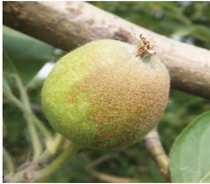
图 10-15 幼果药害