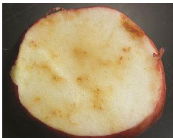
图 22-4 被苹果蛆成虫刺伤产卵的果实