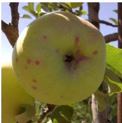
图 22-2 圣约瑟虫在成长中果实上的为害状

切去树皮，树枝内部颜色变红。该虫为害严重时可导致树势降低，生长减慢和产量下降。为害果实大多集中在花萼周围和果柄处，虫斑周围经常造成一个红色晕圈（图 22-2）。为害严重时会导致苹果偏小、畸形或着色不均匀。在安大略省，该虫在夏季存在世代重叠，所以从落花后一直到收获期，苹果果实都有受害的风险。