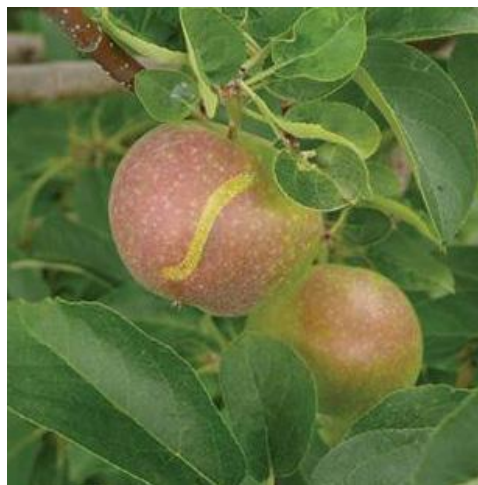
图 22-3 收获期欧洲苹果叶蜂的典型为害状

如果在一块儿试验园中监测到该虫，控制的最好的方法是：每年，在害虫未完全越冬前，即虫体形成保护性的蜡质层之前，将休眠喷油施用到虫体上。然而，药剂喷施的覆盖程度和使用时期对油剂药效的发挥起着至关重要的作用，因为该药剂只对若虫有效，而对成虫没有影响。这意味着推迟休眠喷油的使用时间会降低杀虫的效果。