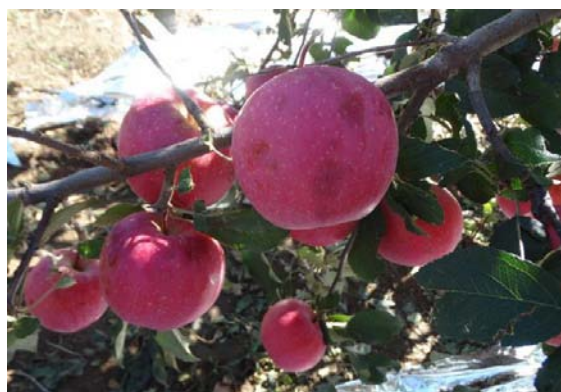
图20-2 未采摘的雹伤果