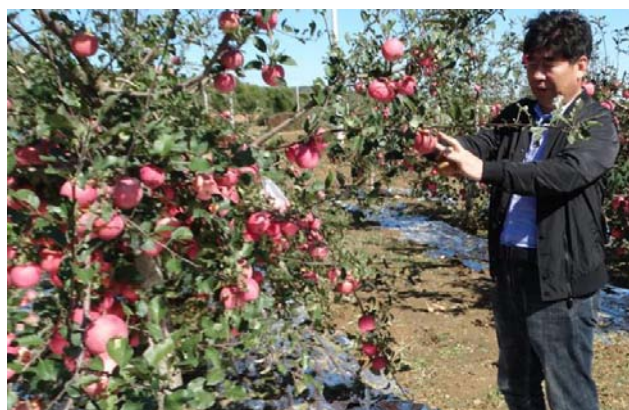
图20-3 树叶遭冰雹破损