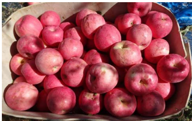
图20-1 受冰雹损害的残果

四是及时为果农提出管理意见和参考。由于果实已经成熟，建议果农及早采摘严重的伤残果，及早销售，避免病害感染，防止进一步损失。在确保果品质量安全的前提下，喷洒50%多菌灵500倍、70%甲基硫菌灵1000倍等杀菌剂进行病害预防，避免烂果病的偏重发生。同时，汲取灾害教训，积极推广借鉴意大利冰雹预防模式，建议由保险公司与防雹网生产企业合作，为果园安装防雹网，减少冰雹、鸟害等损失。