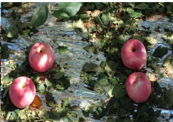
图20-4 冰雹打落的叶片、残果