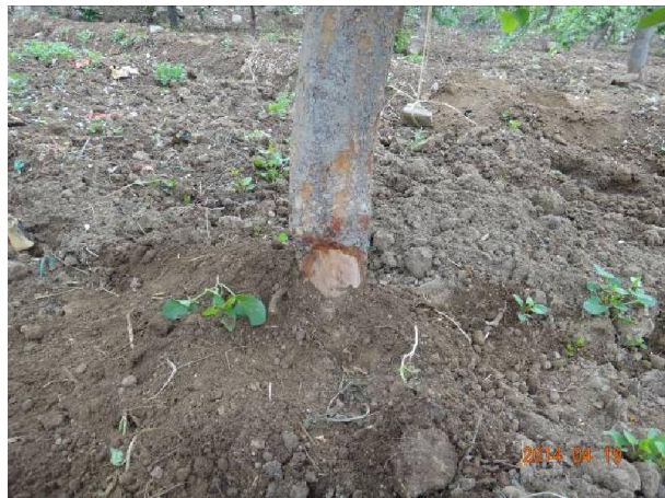
图 8-4 发生在主干基部的腐烂病,已经培了一部分土,仍有部分病斑裸露在外