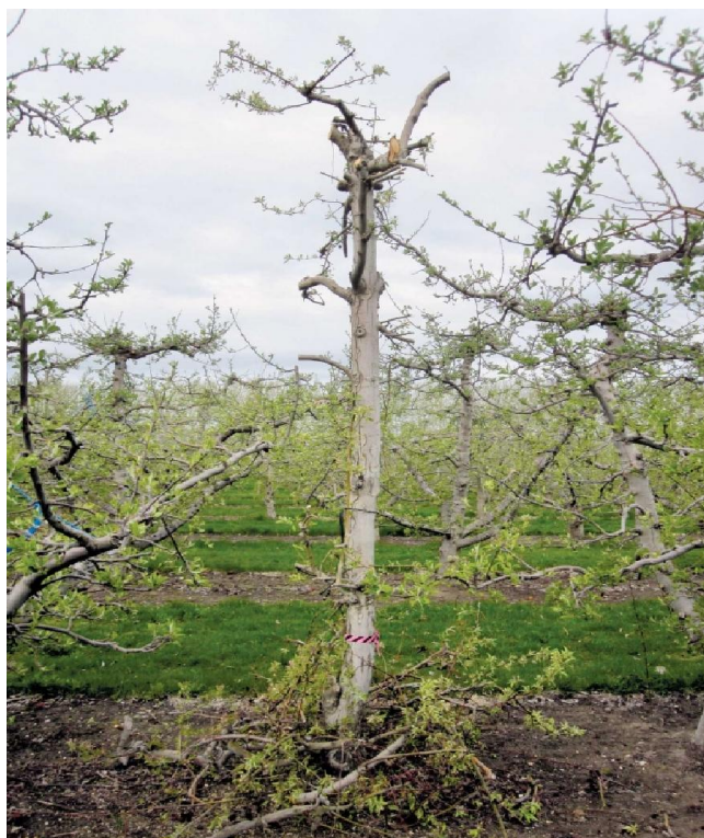
图 8-7 使用电锯修剪这棵授粉沙果树,很迅速地便移去了表现溃疡的木质部