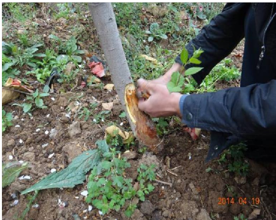
图 8-3 果农对发生在主干基部的腐烂病正在进行刮治

发生在主干基部的腐烂病对树体危害较大，根基出问题搞不好会直接导致整个树的死亡。遇到这种情况，刮治病斑和对树干涂药是必须的，刮治方法和使用药剂的种类在我们网站的病害防控方案中都有介绍。近年我们的研究发现，中后期的腐烂病斑都有病菌在组织内扩散的现象，因此，虽然表面的病斑已经过刮治，但是还要防范以后病斑的复发。裸露的疮面因散失水份会使树势下降，极易导致病斑的复发，因此，建议在刮治