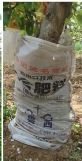
图 8-5 对基部带有腐烂病斑的主干采用的特殊培土方式