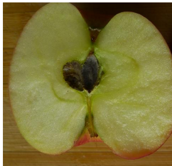
图 8-1 苹果霉心病

苹果霉心病发生广泛，在世界各苹果产区几乎均有发生。在我国，陕西、山东、河南、山西、辽宁、四川、甘肃、北京等省市均有该病害发生危害。据我们近几年在陕西洛川、白水等地大量调查，病果率 7.9%-36.6%，平均病果率达 20.1%。