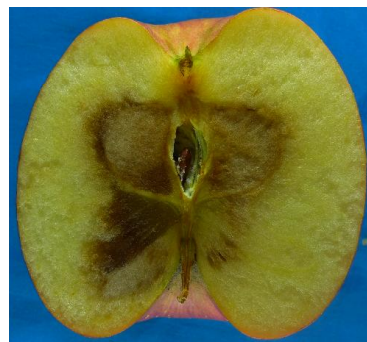
图 8-2 苹果心腐病

对于霉心病，国外开展了大量药剂防治研究，研究表明苯莱特、克菌丹、多果宁、异菌脲、代森锰锌等杀菌剂效果不佳，其它一些农药，如多抗霉素、甲氧基丙烯酸酯类、肟菌酯类等有一定防效，但防治效果不稳定，在年度间、果园间差异较大。