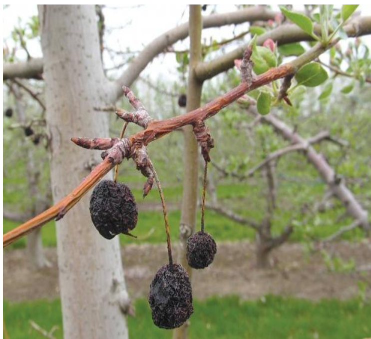
图 8-6 满洲沙果上的一个枝条显出溃疡病的症状