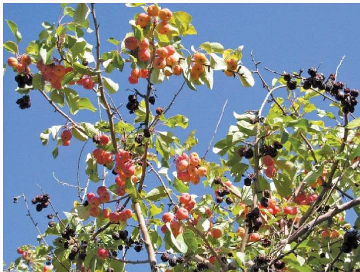
图 8-9 一棵带病的满洲沙果，上一个季节留下的病僵果和这个季节的新沙果一同出现的情形

Kim 说，孢子可以在枝干上萌发，也可以通过气孔，裂口或者皮孔侵入果实组织。一旦病害进入果实内部，杀菌剂就会失去作用，这就是为什么我们要消除所有的孢子。