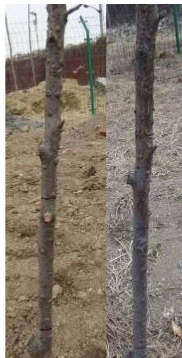
图 6-12 一年间轮纹病的症状变化