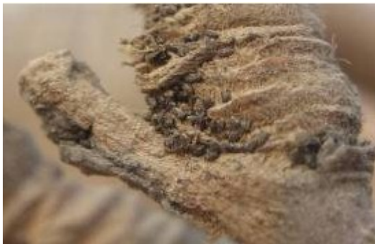
图 6-5 苹果黄蚜越冬卵 (3月28日摄)