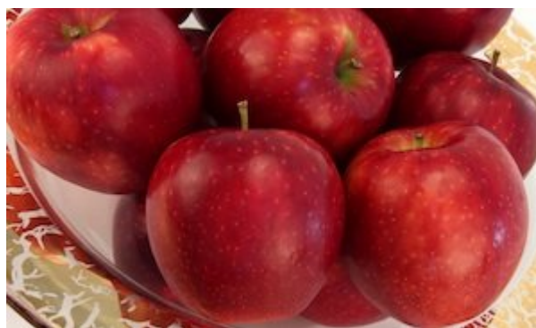
图 6-13 硬度好、脆、多汁的大个 WA38 苹果品种

与 WSU 正在实施的第一个苹果品种 WA2 的推广模式不同。WA38 授权拥有者的权利包括可以将树苗的繁育外包给育苗单位或其他单位，并转让品种授权给种植户，经营商标，获得版税。这需要一个把 WA38 树苗销售给种植者和育苗者的商业计划。