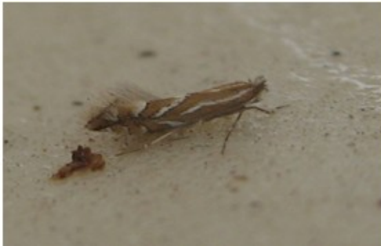
图 6-3 金纹细蛾雄蛾 (3月27日摄)

4月份的气温回升较快，果园内各种越冬害虫都将解除冬眠开始上树为害，4月1日~15日期间，将迎来金纹细蛾越冬代成虫羽化高峰，苹果黄蚜的卵和苹果全爪螨卵此时也都将孵化，苹小卷叶蛾越冬幼虫也将从树皮爬至还未完全展开的小叶上为害，苹果绵蚜也在枝干的疤痕处开始取食。4月10日左右苹果花序分离至露红期苹果上大多数害虫都会上树为害，此时树叶还未展开，树冠通透，喷药效果好，因此是喷施杀虫剂防治苹果害虫的最关键时期，可以与杀菌剂一起使用。喷药前要做好虫情调查，根据果园内具体发生的害虫种类和数量，选择使用阿维菌素(防治红蜘蛛)、高效氯氰菊酯(防治卷叶蛾类)或乐斯本(重点防治苹果绵蚜)等药剂。