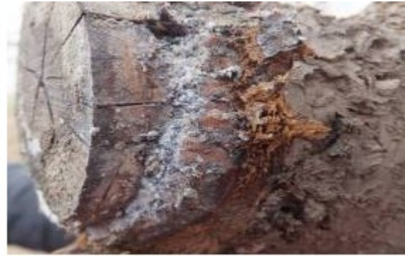
图 6-8 剪锯口处越冬的苹果绵蚜 (3 月 27 日摄)

3 月下旬花芽开始露白 (图 6-9), 正是腐烂病发生的高峰时段, 经过越冬的消耗, 树体营养水平下降, 腐烂病多呈现快速增长阶段, 主要表现是病斑面积迅速扩大, 有的表现“冒水”(如图 6-10), 这段时间也是刮治腐烂病斑的关键时期, 可按照今年信息简报第 5 期的病害防控规程进行操作。4 月上旬是防控各种病虫的关键时期, 一定要在开花之前喷药进行保护。