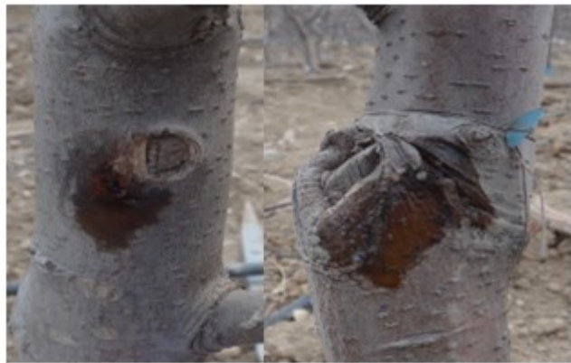
图 6-10 因腐烂病引致的果树“冒水”

春季正直新建果园栽树的季节, 此时要特别注意检查苗子的质量, 发现感染轮纹病的苗子一定要淘汰。根据我们近年的观察, 携带轮纹病的树苗异地调运是造成该病发病面积加大、为害加重的重要原因。由于苗圃种植的树苗非常密集, 造成苗圃的用药防病非常困难。基砧或中间砧的剪口处又特别容易被轮纹病菌侵染, 而导致干腐型病斑, 干腐型病斑的分生孢子器遇雨释放分生孢子, 再从皮孔侵入, 就会造成下部的树皮染病而形成病瘤 (图 6-11), 我们平常所见到的轮纹病多在主干的基部, 将树苗栽种到果园后, 轮纹病会年复一年地从基部向上发展, 苗子生长弱时, 病害发展会很快 (图 6-12)。病苗栽到田间时, 由于初发阶段病瘤较少, 人们往往忽视其存在, 一旦引起重视, 往往已到难以治愈的地步, 病重时再想铲除病瘤和粗皮会非常困难。因此, 加强苗圃的管理非常重要, 对于嫁接的剪口一定要喷药保护, 这样可以从根本上避免轮纹病的发生和传播,