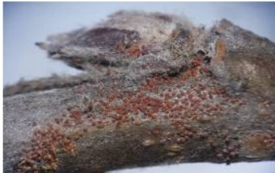
图 6-4 苹果全爪螨的越冬卵 (3月28日摄)