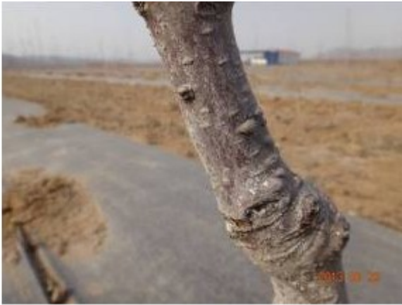
图 6-2 中间砧部位由轮纹病造成的病瘤