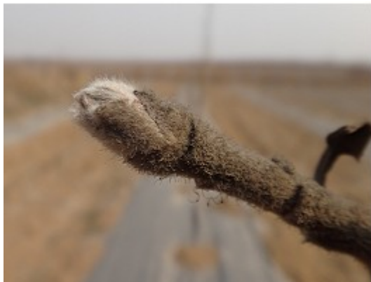
图 6-9 保定曲阳县苹果物候 (3 月 23 日)

3 月下旬花芽开始露白 (图 6-9), 正是腐烂病发生的高峰时段, 经过越冬的消耗, 树体营养水平下降, 腐烂病多呈现快速增长阶段, 主要表现是病斑面积迅速扩大, 有的表现“冒水”(如图 6-10), 这段时间也是刮治腐烂病斑的关键时期, 可按照今年信息简报第 5 期的病害防控规程进行操作。4 月上旬是防控各种病虫的关键时期, 一定要在开花之前喷药进行保护。