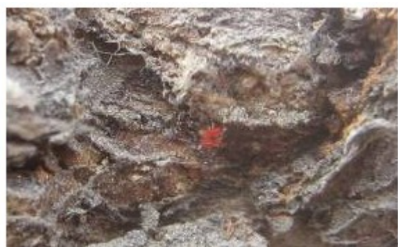
图 6-6 树皮越冬的山楂叶螨 (3月27日摄)