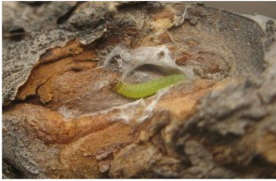
图 6-7 苹小卷叶蛾越冬 3 龄幼虫 (3 月 27 日摄)