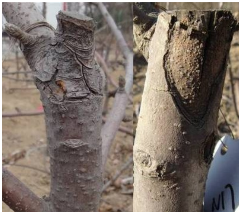
图 6-11 剪口处干腐的分生孢子又侵染下部树皮形成病瘤

尤其对矮化中间砧的苗子，由于嫁接次数多，感染机会也多，更要注意对剪口的喷药保护。