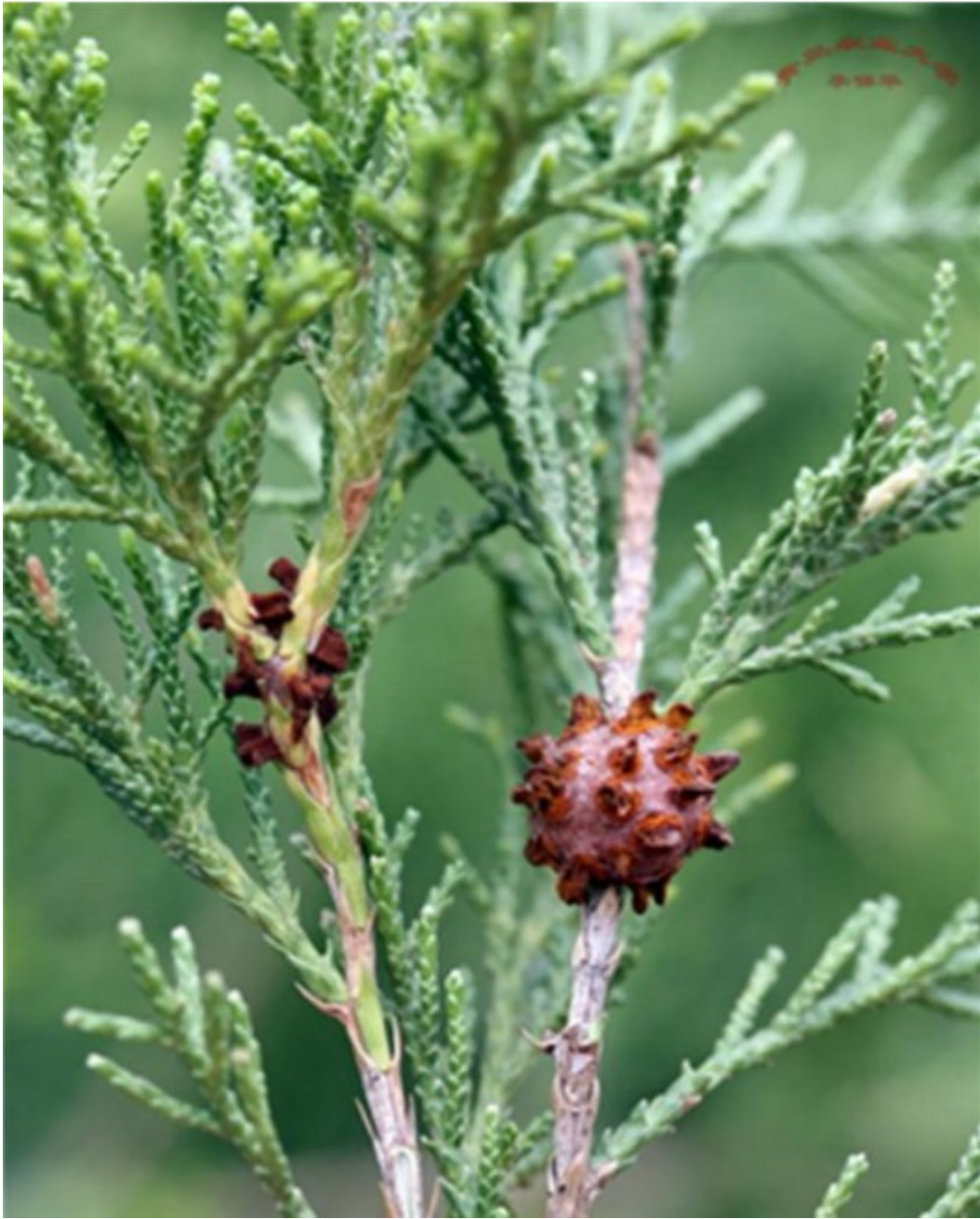
图 8-1 锈病菌的冬孢子角（左：梨锈菌；右：苹果锈菌）