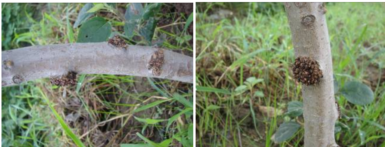
图 8-13 气生瘤症状图

（该文选自 Compendium of Apple and Pear Diseases, APS Press）