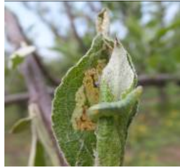
图 8-12 苹小卷叶蛾幼虫及危害状