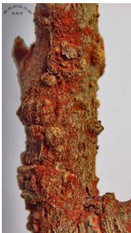
图 8-2 枝条上苹果红蜘蛛的越冬卵

8. 注意事项：红蜘蛛对杀螨剂很容易产生抗药性，建议各种杀螨剂轮换使用，同一种杀螨剂在一年之内的使用次数不要超过 2 次。落花后和套袋前不建议使用乳油，使用不当会影响果实表光。