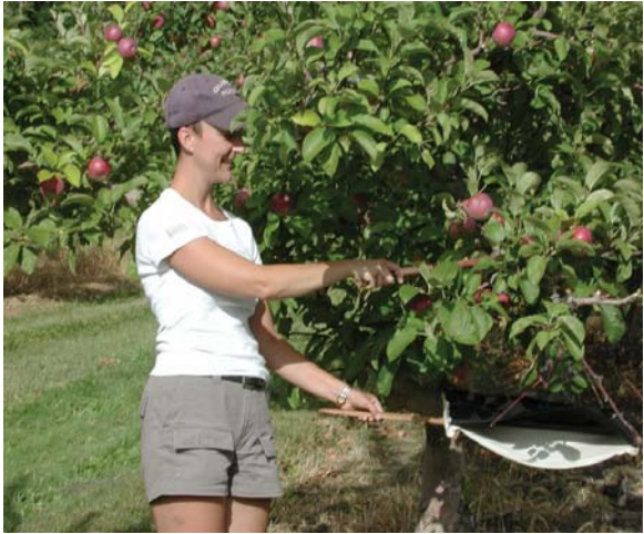
图 8-15 震落法调查