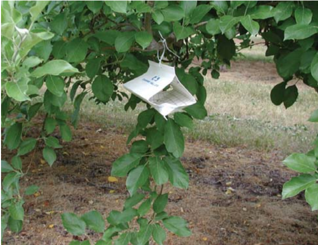
图 8-14 诱捕器

(该文选自 http://www.omafra.gov.on.ca/IPM/english/apples/ipm-basics/how-to-scout.html )