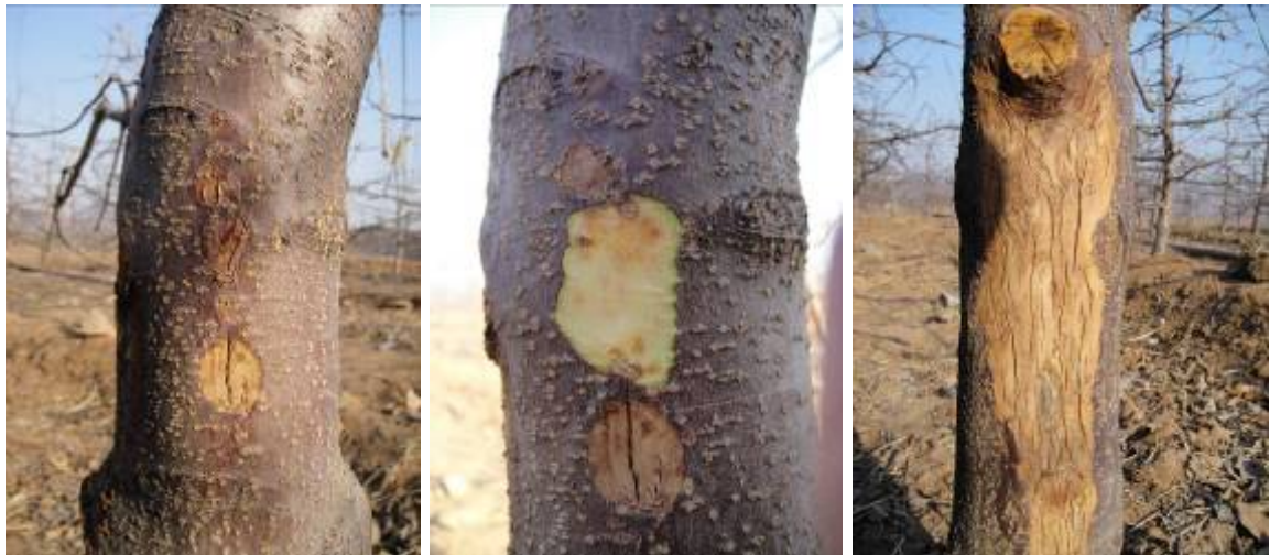
图 8-8 草甘膦药害造成主干基部树皮坏死和开裂