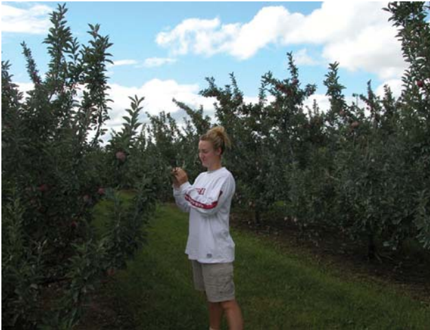
图 8-16 目测法调查