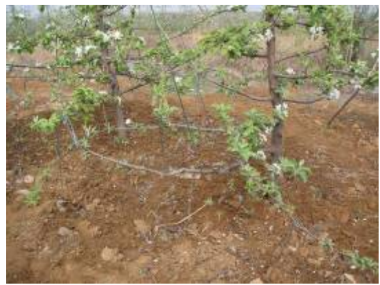
图 8-7 表现草甘膦药害的枝条位于近地面处