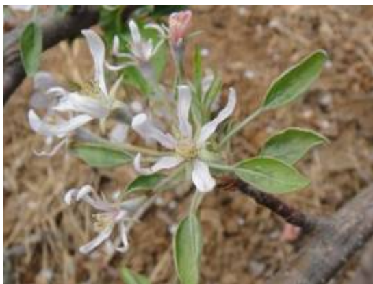
图 8-6 苹果树因草甘膦药害呈现“百合花瓣”