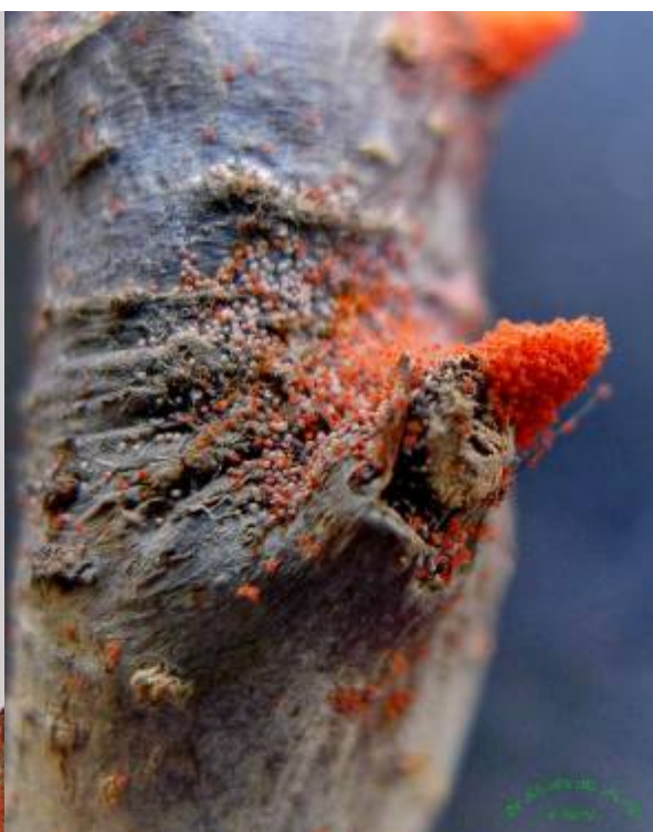
图 8-3 苹果红蜘蛛刚孵化的若螨