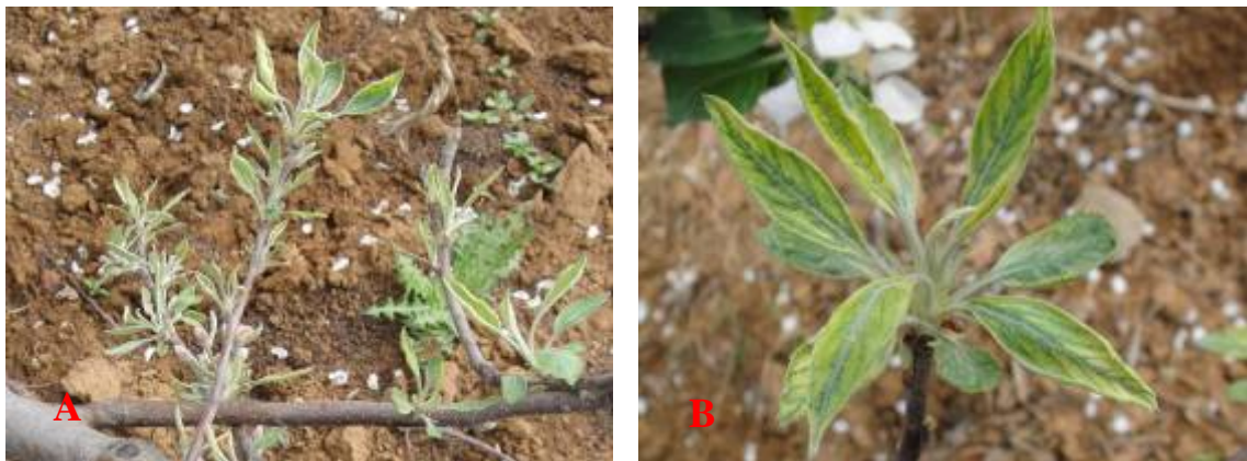
图 8-5 苹果树因草甘膦药害出现节间短缩 (A) 和叶片脉间失绿 (B)