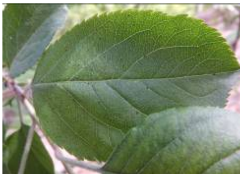
图 8-9 已经喷施两次杀螨剂的果园叶片上的苹果全爪螨（2012. 4. 26 拍摄，望都）

近期调查走访结果表明，今年河北省保定地区苹果园内苹果全爪螨发生普遍且严重，调查的 8 个苹果园中，有 6 个果园发生苹果全爪螨，且均达到防治指标，其中一个果园发生数量非常大，属于大发生，这些果园已经进行了药剂防治，但是残余的数量仍较高（图 8-9），应该密切关注该虫的发生动态。苹果全爪螨以卵在枝干上越冬，现在已经发生了一个世代，正值越冬代成虫产卵期，我们测定了 7 种常用杀螨剂的杀卵活性，效果均不够理想，建议在卵孵化后再喷施阿维菌素、四螨嗪或哒螨灵等药剂防治。目前保定苹果园内金纹细蛾越冬代成虫期已经结束（图 8-10），此时处于卵孵化期及幼虫为害初期，症状不明显，上一年危害严重并且冬季未清除落叶的果园此时可以喷施灭幼脲进行防治；梨小食心虫目前处于越冬代成虫盛发期（图 8-11）；苹小卷叶蛾越冬幼虫早已开始为害，目前已经达到老熟幼虫期（图 8-12），各果园应加强管理，看到受害叶苞及时摘除并捏死其中的幼虫。苹果黄蚜的数量已经开始上升，但是仍然较少。