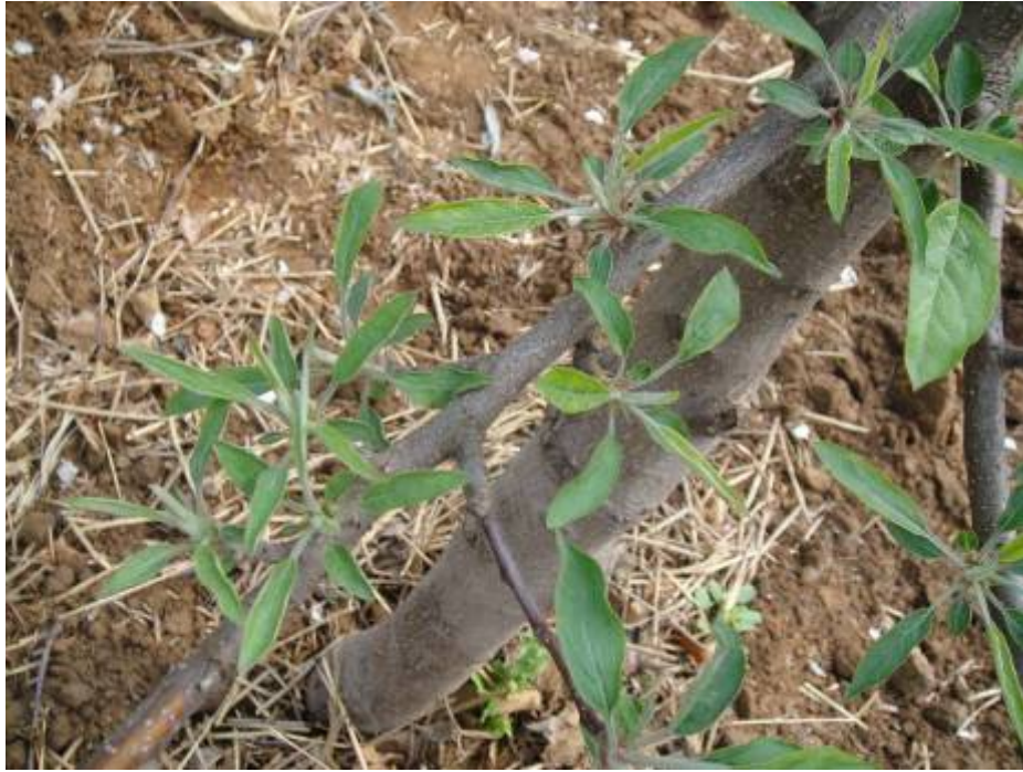
图 8-4 苹果树因草甘膦药害叶片呈“柳叶”状