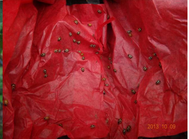
图 19-9 分散在果袋内部的龟纹瓢虫

我们在国外考察时曾经见过有的果园悬挂着一些花盆，花盆内部放置着一些干草，据说是为天敌昆虫创造的越冬场所。不难想象，成团的干草有利于保温，悬挂在树上又能够防潮，花盆内部的黑暗条件可使越冬昆虫感觉到安全。因此，今年 10 月在果实解袋后，我们专门在 4 亩的试验园悬挂了 100 多个带草的花盆，希望此举能够为天敌昆虫创造一个良好的越冬条件。这是我们首次放此装置，从放置时间上来看有些偏晚，最好在 9 月份就开始放。另外，这种装置也有可能成为其他中性昆虫甚至是个别害虫的