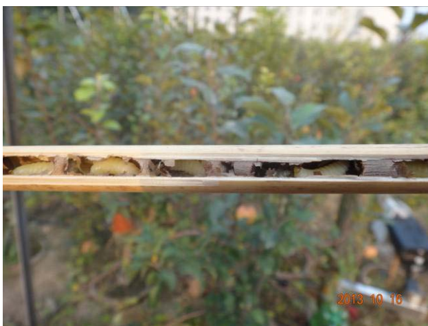
图 19-14 剖开苇管可见内部壁蜂的老熟幼虫