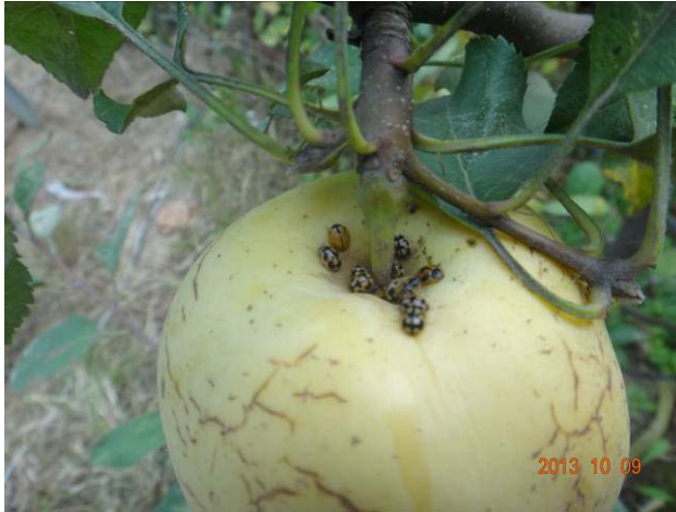
图 19-8 聚集在果袋内萼凹处的龟纹瓢虫

秋季，天气逐渐变凉，很多天敌昆虫也开始寻找能够安全越冬的庇护所。我们在今年 10 份进行试验园果实解袋时，发现很多果袋的折缝中、果袋内和果实的萼凹处有很多瓢虫，有时一个果袋内可以达到上百个。这些瓢虫都是重要的天敌昆虫，尤其对果园蚜虫和红蜘蛛具有非常强的控制作用。遗憾的是随着果袋的去除，这些瓢虫不得不另寻庇护场所，能否安全越冬也成了一个未知数。