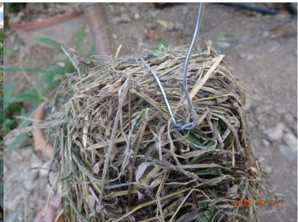
图 19-11 花盆内部为成团的干草