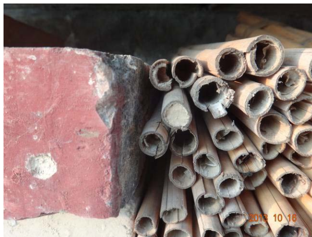
图 19-13 部分砖上的孔和苇管已被泥土封闭