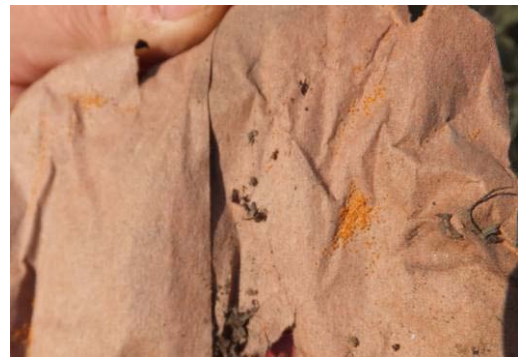
19-5 果袋上集聚的二斑叶螨越冬雌螨 (10月9日摄)