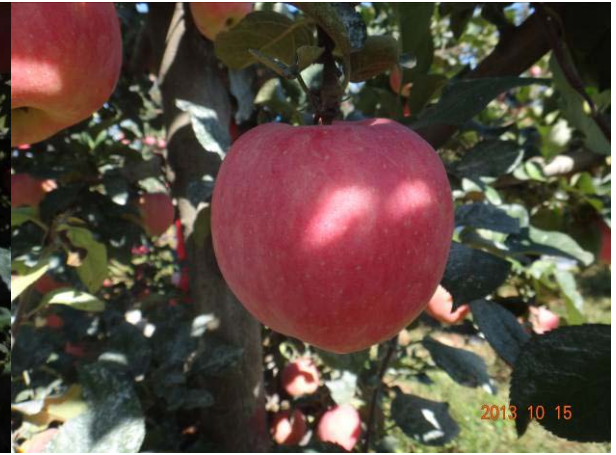
图 19-2 去年秋季施用木美土里后果实恢复正常

要点，介绍了目前正在筹备的病虫害远程监控系统、果园信息采集系统、远程灌溉控制系统以及苹果病虫害防控信息网等现代技术。