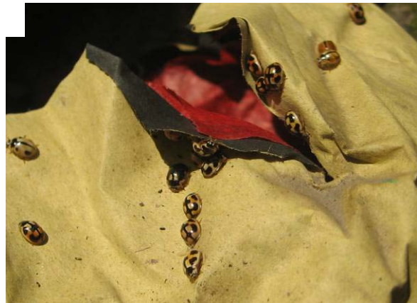
图 19-7 龟纹瓢虫成虫在果袋上聚集

已建议该果园将摘下的果袋进行销毁处理，落叶后彻底清除园内枯枝落叶并刮除树干上的老翘皮，以减少越冬虫源。在望都县各苹果园调查时见到大量龟纹瓢虫的越冬成虫，很多集聚在果袋封口处或袋内（图 19-7），建议果农在处理废弃的果袋时要注意保护天敌。