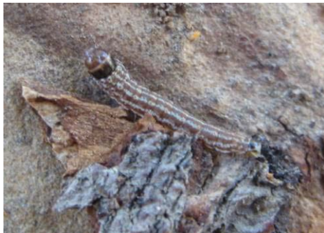
图 19-6 在苹果树树干老翘皮下的黑星麦蛾越冬幼虫 (10月9日摄)