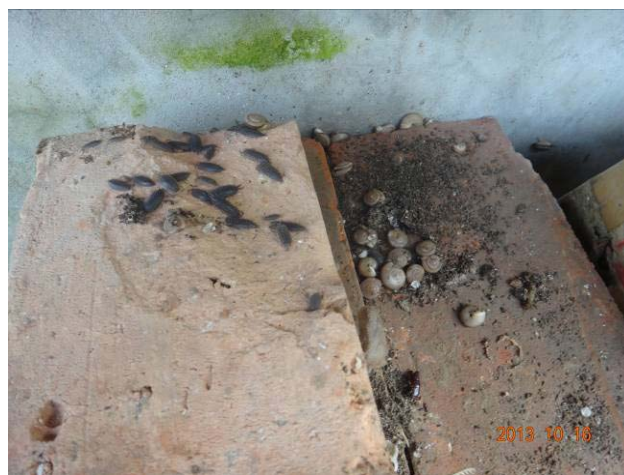
图 19-15 聚集在砖缝的蜗牛等其他生物