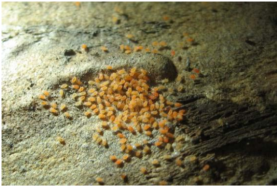
图 19-4 老翘皮下集聚的二斑叶螨越冬雌螨 (10月9日摄)