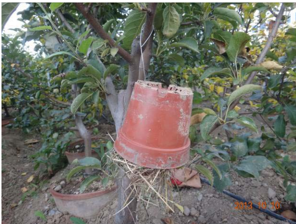
图 19-10 倒置悬挂在果树上的塑料花盆

我们在国外考察时曾经见过有的果园悬挂着一些花盆，花盆内部放置着一些干草，据说是为天敌昆虫创造的越冬场所。不难想象，成团的干草有利于保温，悬挂在树上又能够防潮，花盆内部的黑暗条件可使越冬昆虫感觉到安全。因此，今年 10 月在果实解袋后，我们专门在 4 亩的试验园悬挂了 100 多个带草的花盆，希望此举能够为天敌昆虫创造一个良好的越冬条件。这是我们首次放此装置，从放置时间上来看有些偏晚，最好在 9 月份就开始放。另外，这种装置也有可能成为其他中性昆虫甚至是个别害虫的