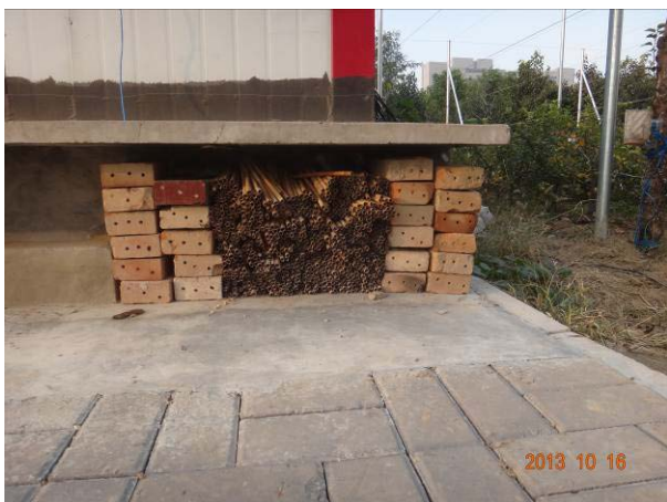
图 19-12 放置在果园附近的砖和苇管

早在今年春天我们就在试验园的不同角落放置了一些芦苇管，在芦苇管旁边的砖上也用电钻打了不少十几厘米深的孔，希望这些装置能够成为一些蜂类的越冬场所。10月16日，对防置的这些砖和苇管进行观察，确实发现有些孔眼已经被昆虫用泥土堵住，将苇管剖开后发现，里面已经有类似壁蜂的老熟幼虫在蠕动。壁蜂能够帮助苹果授粉，是果园的益虫。当然，搬开砖块也能看到还有不少其他种类的生物，包括蜗牛以及鳞翅目昆虫的虫茧等，因此，明年早春对这些场所也要针对不同生物进行分项处理。