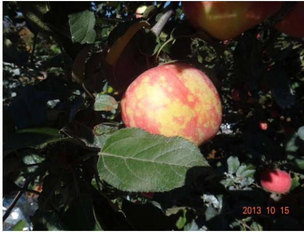
图 19-1 去年施用水解油渣后花脸病仍然严重