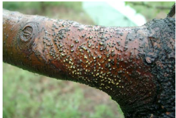
图 3-1 苹果树腐烂病的症状

借助分子生物学检测技术，两年以前我们曾在健康苹果树的枝干上检测到了腐烂病菌的普遍存在，按照这个思路，2016-2017 年我们利用本实验室建立的 qPCR 技术对购自张家口怀来、江苏沐阳、云南丽江和河北保定 4 个地区的八棱海棠种子进行了检测，结果如表 1。出人意料的是海棠种子普遍携带腐烂病菌，不同地区的种子带菌率存在差异，江苏、保定地区的种子带菌率都高于 40%，张家口的种子带菌率也在 12% 以上。4 个地区的带菌量集中在 10^2 - 10^3 copies/g，其中购自江苏的海棠种子平均带菌量最高，达到 2.76 \times 10^3 copies/g。