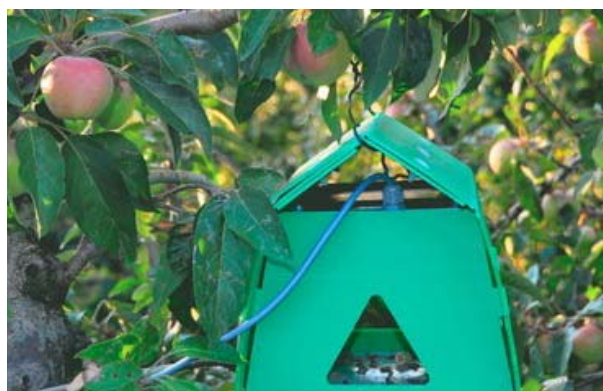
图 7-11 安放在果树上的诱捕装置

现在 SemiosBIO 公司的昆虫学家只要坐在位于东温哥华大北路的科技园区办公室内，通过检查电脑屏幕上的照片就能统计诱捕器内害虫数量。在不久的将来，害虫计数将通过能够识别成虫数量激增的电脑程序来处理。