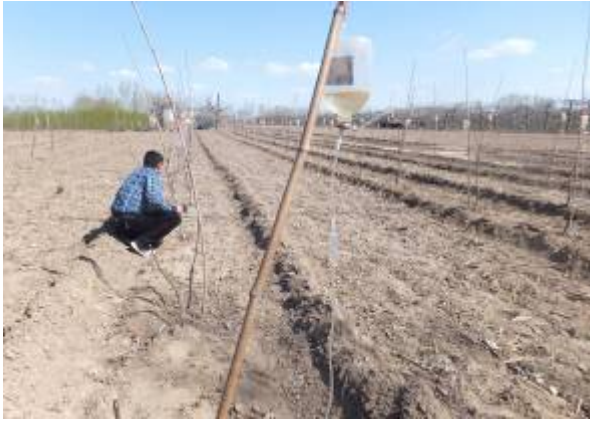
图 7-7 正在给新栽的苹果树输营养液