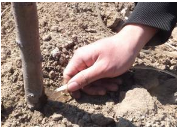
图 7-9 插入树干基部的塑料针头