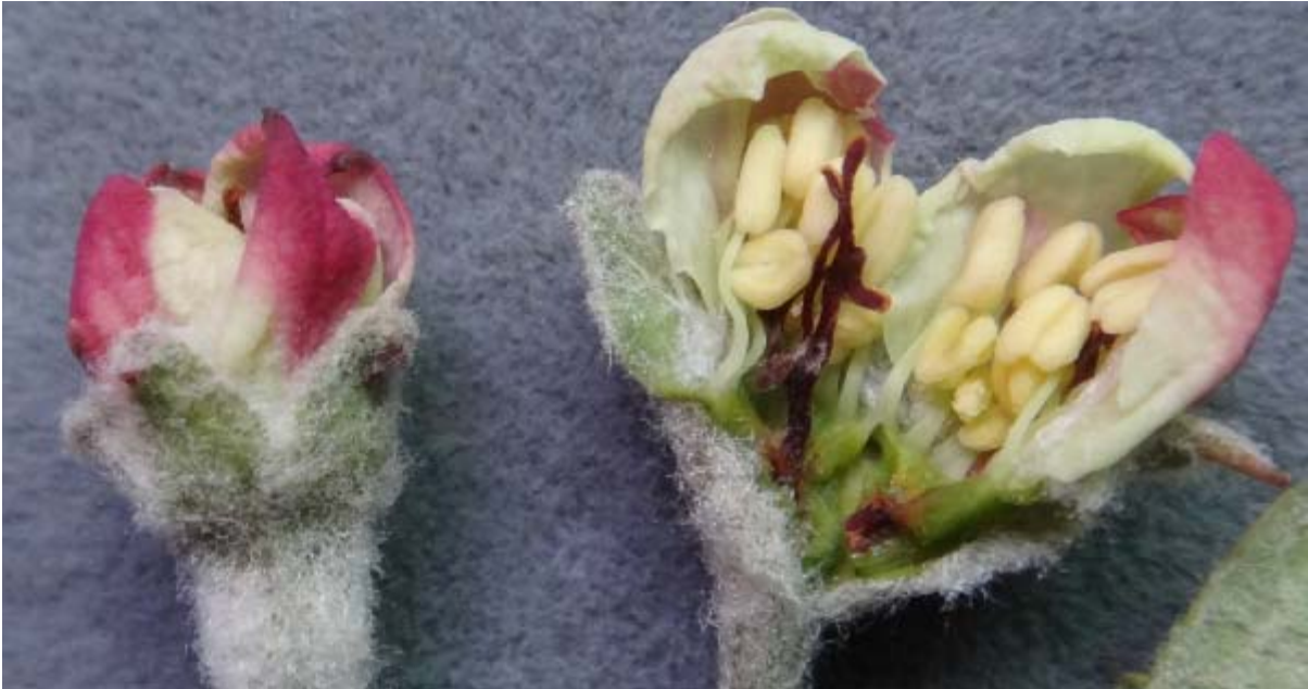
图 7-1 花器受冻情况（拨开花瓣后可见雌蕊已经变褐）

幅降温，不少地方的苹果树遭遇到花期冻害，培训期间，病虫害防控研究室的人员与产业技术体系张军科站长、岗位专家王金政研究员、任小林教授等查看了灾情并进行了交流。在对洛川和宜川的 10 余个果园的调查中，不同果园花器受冻率高达 60%或 90%以上。近期，苹果产业技术体系的技术简报也分别报道了陕西、宁夏等地花期冻害的情况，看来减产已成定局。但是，越是在这样的情况下，越要加强对果树的管理，防止因放松管理导致后期病虫害加重而对来年产量造成影响。在此，也特别提醒广大果农朋友，晚霜期尚未结束，月底之前还有降温的可能，还有很多地区的果树尚未开花，应特别关注天气预报，一旦预报夜间温度在零度以下，要采取提前灌水、喷营养液、即时熏烟等措施，尽一切可能减轻低温对花器的伤害。