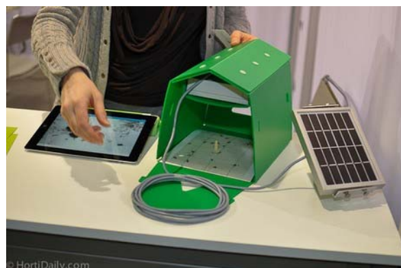
图 7-12 诱捕装置组成

一旦人工或者照片识别程序监测到虫口开始激增，一条指令就会传输回放置在果园内的一个鞋盒大小的装置，然后这个装置就会开始释放性信息素，雄虫受空气中的性信息素的干扰就无法找到准备交尾的雌虫，雌虫在苹果表面产的卵无法受精，苹果就免于被幼虫钻蛀为害。