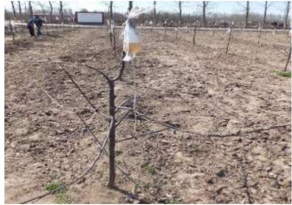
图 7-8 正在给两年生苹果树输液