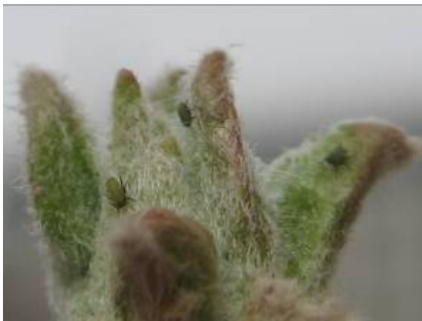
图 7-5 苹果黄蚜初孵若虫