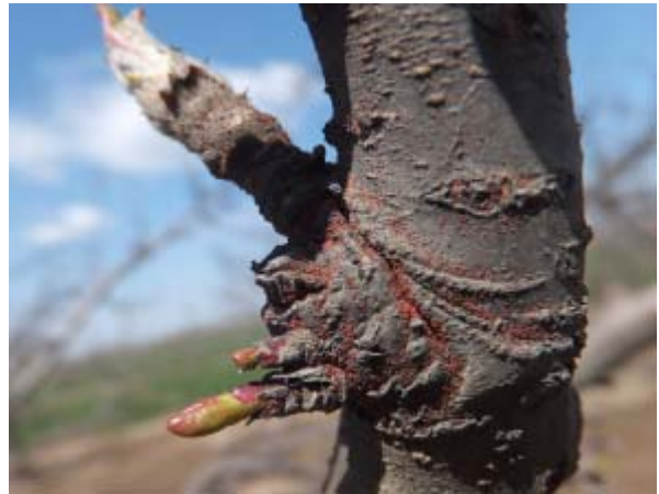
图 7-4 苹果全爪螨越冬卵