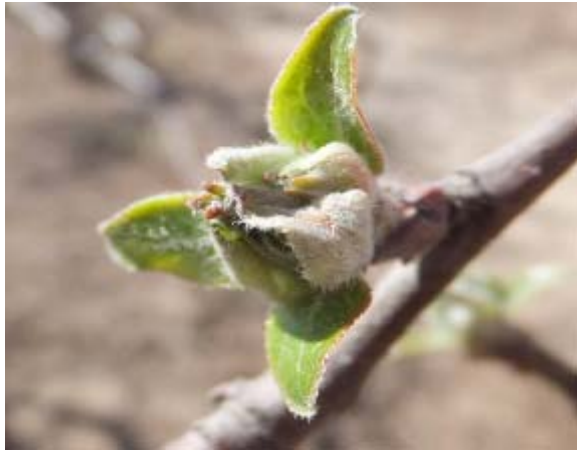
图 7-3 富士苹果树当前的物候