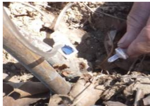
图 7-10 输液的塑料插头及树干上的插入孔