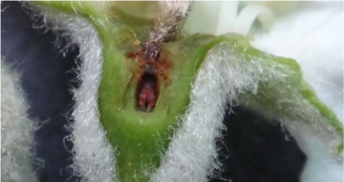
图 7-2 低温对花器的伤害（受冻的子房已经变褐）