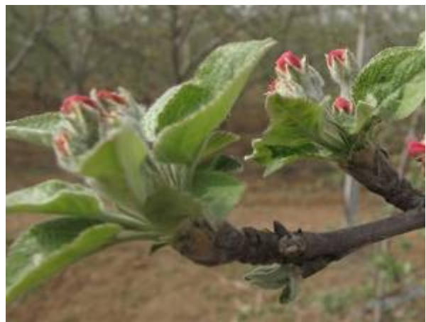
图 7-6 苹果花序露红期